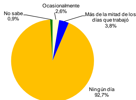
Distribución porcentual de Ocupados por Frecuencia con la que trabajan en su domicilio particular. Castilla y León. Año 2011

El 92,7% de los ocupados en el año 2011 no trabajó ningún día en su domicilio particular, un 2,6% lo hizo ocasionalmente y un 3,8% trabajó en casa más de la mitad de los días que trabajó.