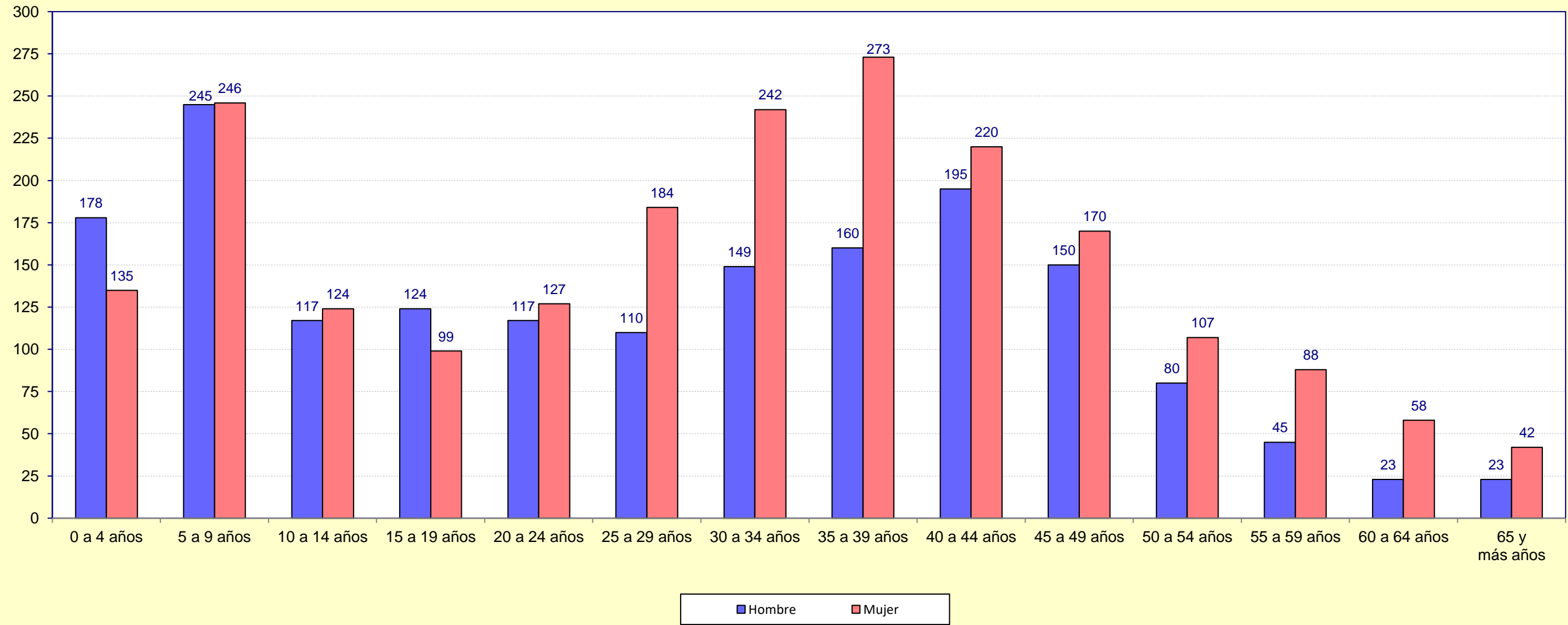
Gráfico 2. Adquisiciones de nacionalidad española por Grupo de edad y Sexo. Castilla y León. Año 2021